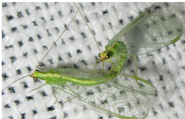
Coppia in Baviera, 2009