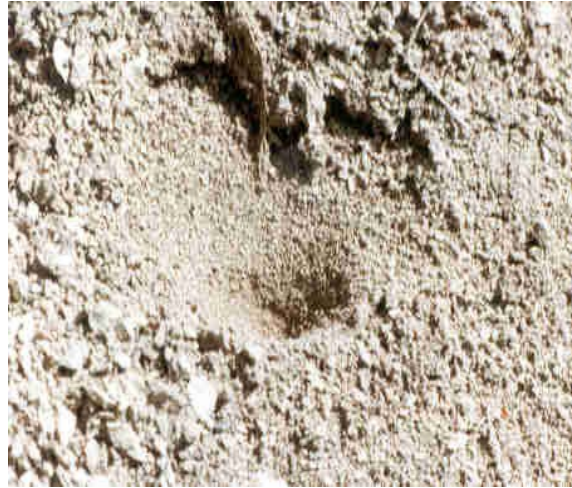
Imbuto larvale

Specie relativamente euriecia, con larve costruttrici d'imbuto, che rifugge comunque i climi troppo caldi e secchi (Steffan, 1975; Aspöck et al., 1980). In Romagna si trova confinato nella fascia collinare, con sporadiche e del tutto occasionali catture per la pianura e per il crinale (Pantaleoni, 1990). Lungo le scarpate, in microhabitat protetti dalla pioggia per la presenza di una roccia sporgente o delle radici di un albero, dove vi è un po' di terreno smosso, abbondano gli imbuto costruiti dalle sue larve.