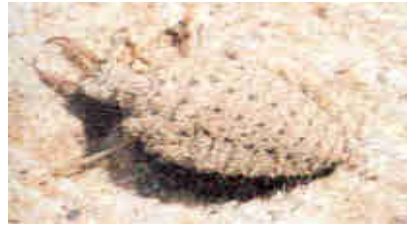
Larva Foto K. Hellrigl, 1992